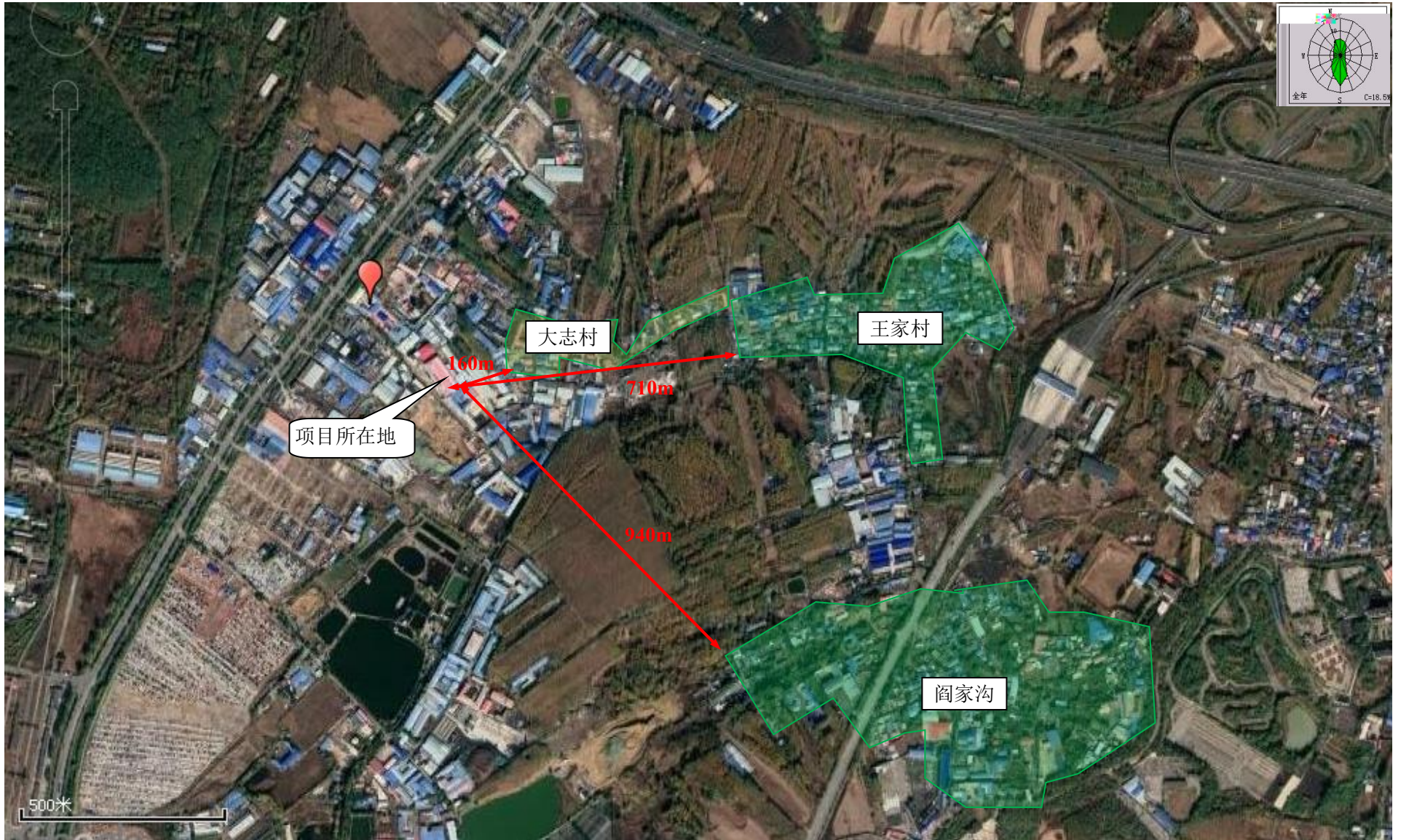
附图3 项目四周敏感目标分布图（比例尺 1:500）